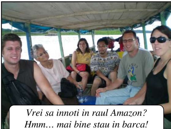
Vrei sa innoti in raul Amazon? Hmm... mai bine stau in barca!

Multumesc pentru rugaciunile voastre. Vedem cum Dumnezeu lucreza si cred ca rugaciunea face o mare diferenta. Tatal nostru este asa de plin de compasiune si este asa de personal. In ultimul timp mi-a vorbit mult despre compasiune despre faptul ca este asa de usor sa presupunem ca cei din jurul nostru au capacitate si ca tot ce au nevoie ca sa iasa din suferinta este un sfat. Am invatat ca sfaturile noastre chiar daca sunt corecte de multe ori nu ajuta dar compasiunea si dragostea niciodata nu dau gres. Multumesc mult pentru ajutorul financiar, nu as fi putut sa merg in toate aceste calatorii fara ajutorul vostru. Fiti binecuvantati!