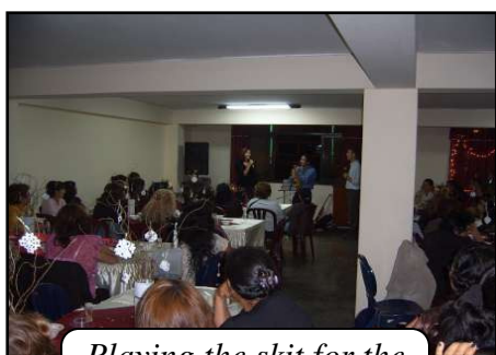
Playing the skit for the Ladies' dinner