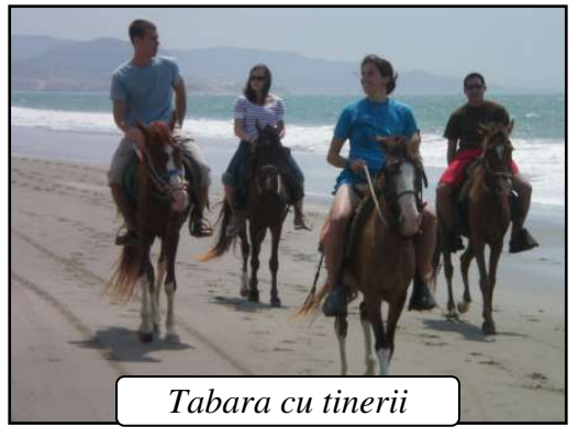
Tabara cu tinerii