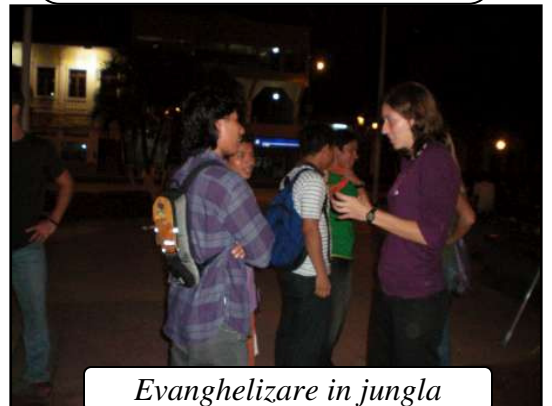
Evangelizare in jungla

Multumesc pentru rugaciunile voastre. Vedem cum Dumnezeu lucreza si cred ca rugaciunea face o mare diferenta. Tatal nostru este asa de plin de compasiune si este asa de personal. In ultimul timp mi-a vorbit mult despre compasiune despre faptul ca este asa de usor sa presupunem ca cei din jurul nostru au capacitate si ca tot ce au nevoie ca sa iasa din suferinta este un sfat. Am invatat ca sfaturile noastre chiar daca sunt corecte de multe ori nu ajuta dar compasiunea si dragostea niciodata nu dau gres. Multumesc mult pentru ajutorul financiar, nu as fi putut sa merg in toate aceste calatorii fara ajutorul vostru. Fiti binecuvantati!