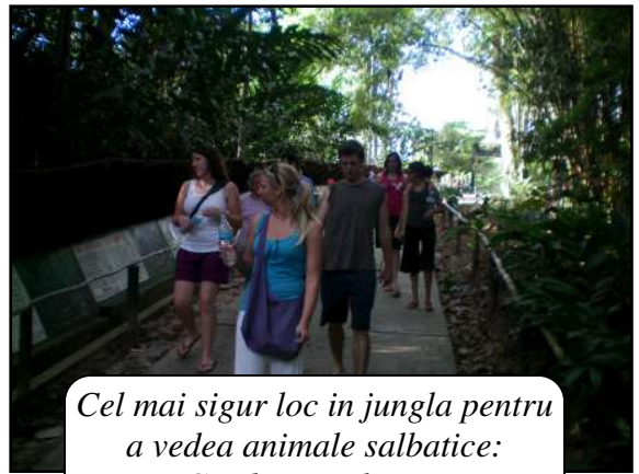
Cel mai sigur loc in jungla pentru a vedea animale salbatice: Gradina zoologica