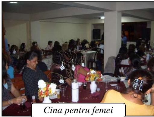
Cina pentru femei