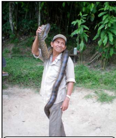
Poza cu anaconda in jurul gatului? Doamne fereste!