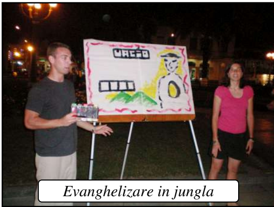
Evangelizare in jungla