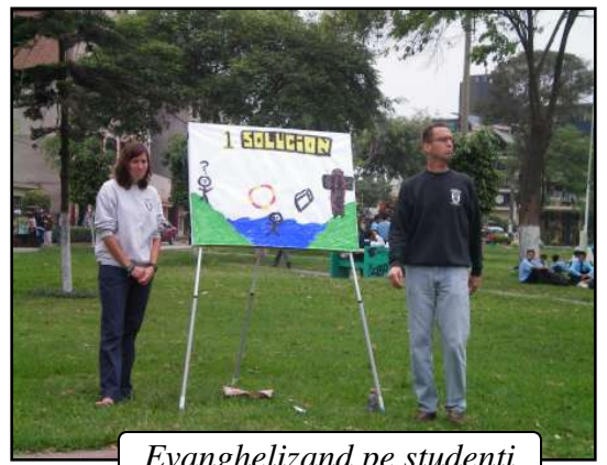
Evangelizand pe studenti